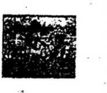
10.0 : A